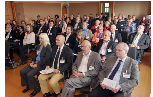
Podium Jahrestagung 2018 in den Dornberger Schlössern zum Thema „Die Vermessung von Körper, Geist und Welt. Die Humboldts und wir heute“

Von besonderer Bedeutung sind unsere Jahrestagungen , die traditionell am letzten Wochenende im Oktober stattfinden. Hier werden gesellschaftlich relevante Themen, wie z. B. Bildung, Moderne Gesellschaft und Naturgefahren , oder das Zusammenspiel von Wirtschaft und Wissenschaft auf einem Podium mit Persönlichkeiten aus Politik und Gesellschaft öffentlich diskutiert. Die Tagungen werden durch ein wissenschaftliches Symposium , auf dem Spitzenforschung präsentiert wird, ergänzt und durch unseren Humboldtabend abgerundet, der immer ein gesellschaftliches und kulturelles Highlight ist.